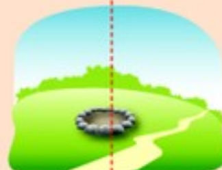
Очистите место от сухой травы и листьев, (зимой – от снега), обложите камнями