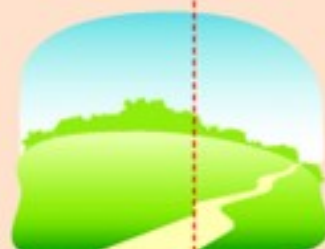
Найдите поляну, защищенную от ветра

ПОМНИТЕ! Любой лесной пожар начинается с маленького очага.