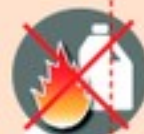
Лить в костер горючие жидкости