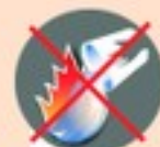
Оставлять костер непотушенным

поведения при лесном пожаре ПАМ'ЯТКА по правилам