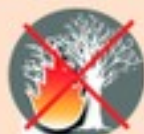
Поджигать сухое стоящее дерево