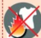
Приближаться в синтетической одежде