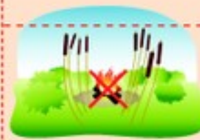
В зарослях сухого камыша