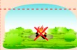
На торфяном болоте