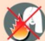
Находиться у костра с распушенными волосами